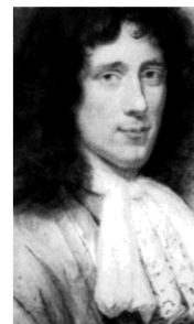
Christiaan Huygens (1629-1695)

Huygens verdankt die Uhrmacherei noch weitere Impulse. So ist die 1675 vorgeschlagene Kombination Unruhe - Spirale bis auf den heutigen Tag das Regulierorgan aller mechanischen, tragbaren Uhren.